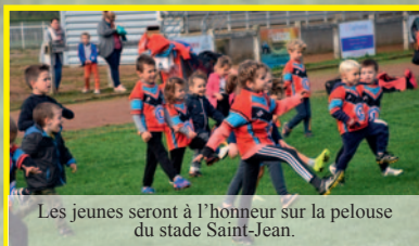
Les jeunes seront à l'honneur sur la pelouse du stade Saint-Jean.

2023 est une année importante pour le RCPN. En effet, le club nogentais va renouer avec l'organisation d'une manifestation majeure. Le 18 mai